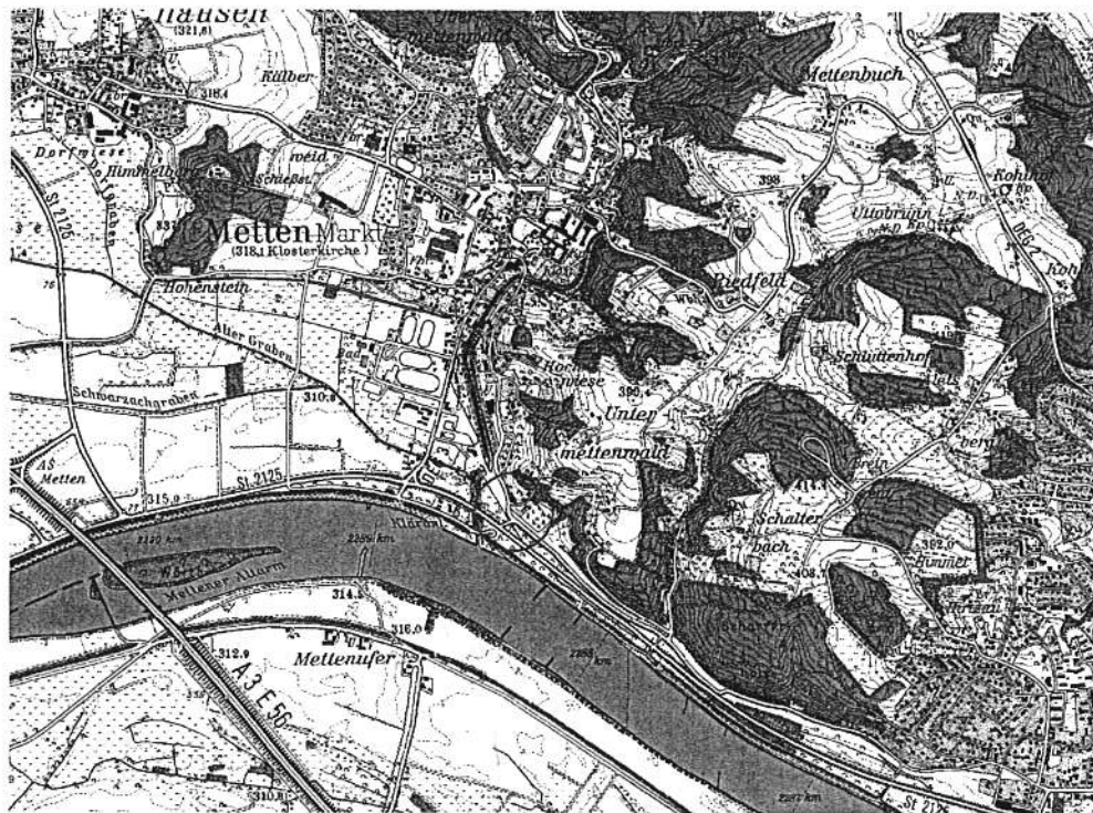
Abb. 1. Lage im Raum

bestehenden Eingrünung eine bedeutende ökologische und Landschaftsbild prägende Rolle zukommen.